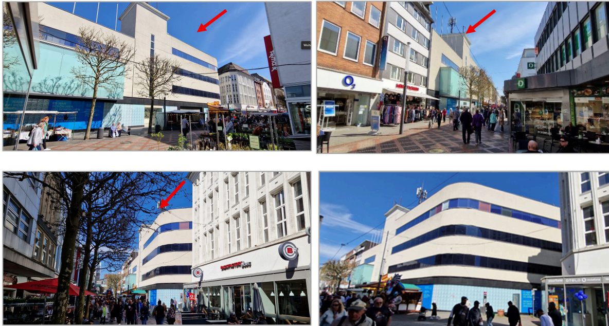
Fußgängerzone Bahnhofstraße mit dem ehemaligen Textilhaus Primark